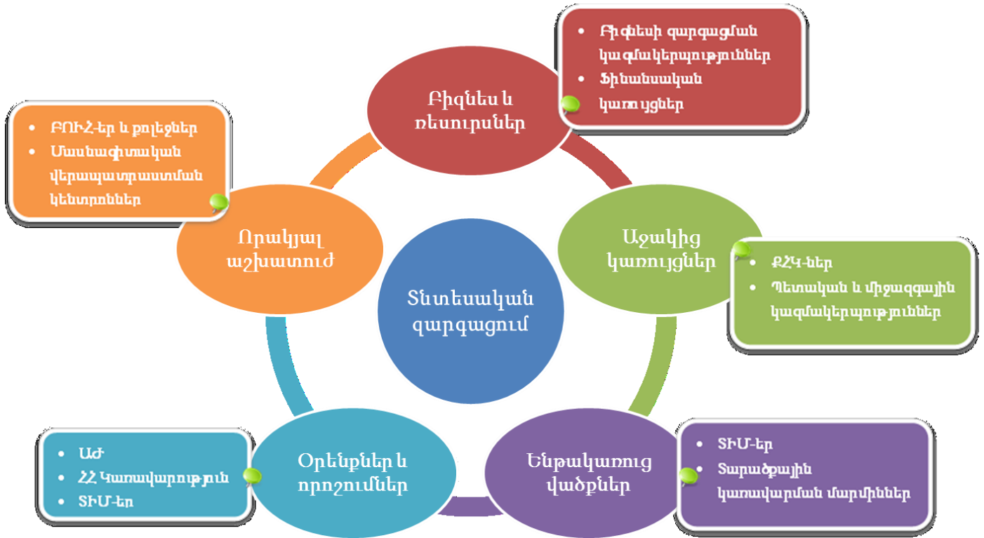
Գծապատկեր 1. Համայնքի տնտեսական զարգացման դերակատարների և նրանց ազդեցության ոլորտների օրինակ

Այդուհանդերձ, տեղական տնտեսական զարգացումը հնարավոր է ապահովել միայն վերոնշյալ դերակատարների նպատակները համադրելու և փոխշահավետ համագործակցություն ձևավորելու միջոցով: